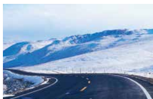
BERGSKEDJA Himalaya finns i Kinas horisont.