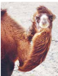
KAMEL Turen börjar handla allt mer om djur och natur.