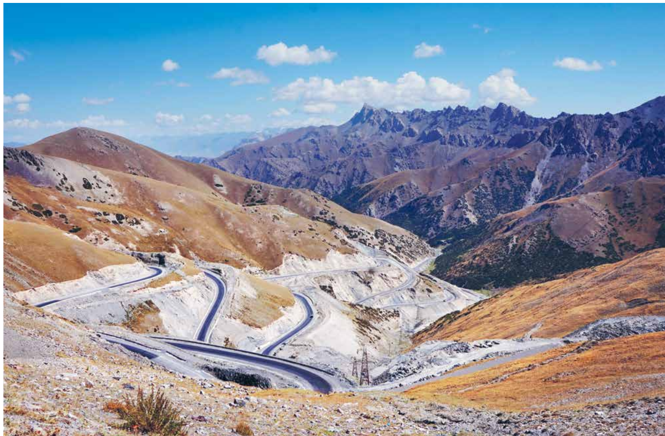
KIRGIZISTAN Bergsvägar och bergsutsikt på hög höjd i Tamirbergen.

Det var därför hon startade den insamling som nu är uppe i 150 000 kronor, men under resan har det fått en mer praktisk innebörd. Utifrån alla de asiatiska hem som hon har blivit inbjuden till minns hon ett särskilt starkt. ▶